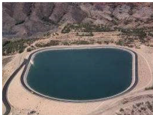
Taibilla, Espagne, 47.000 m 2 , 1998