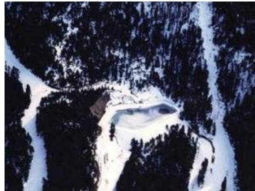
La Masella, Espagne, 7.000 m 2 , 1994