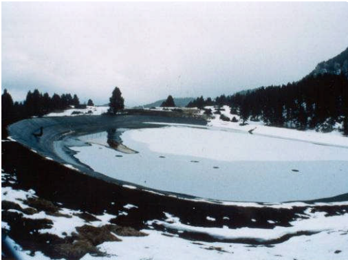
La Molina, Espagne, 8.000 m 2 , 1996