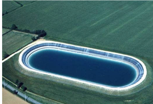
Pamroux, France, 22.000 m 2 , 1998