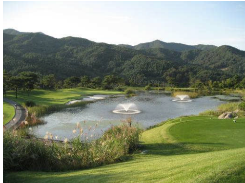
Corée du Sud