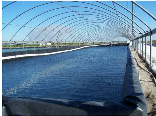
Ocean Boy Florida, USA