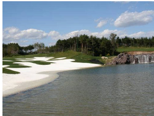
Corée du Sud