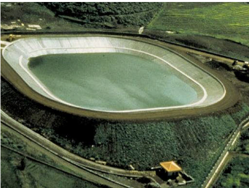
El Boqueron, Espagne, 15.000 m 2