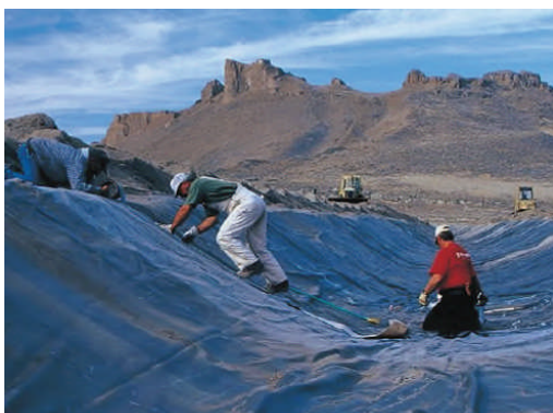
Tulelake Californie, USA, 3,7 km, 2001