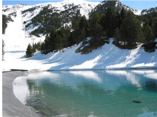
Andorra, Espagne, 9.385 m 2 , 2002