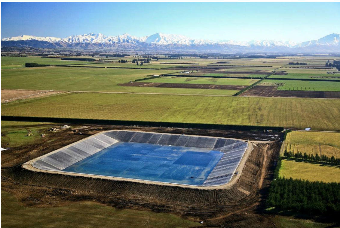
Turley, Nouvelle-Zélande, 62.000 m 2 , 2009

Ce document illustre certains projets de référence réalisés avec la géomembrane EPDM Firestone dans le monde entier.