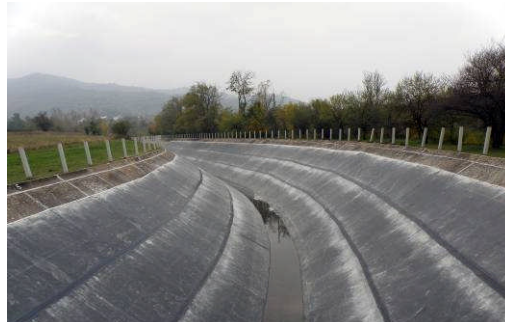
Vlasinske Hidroelektrane, Serbie, 3.200 m 2 , 2006-2008