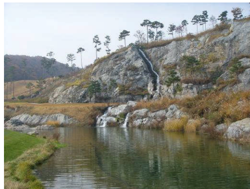
Corée du Sud