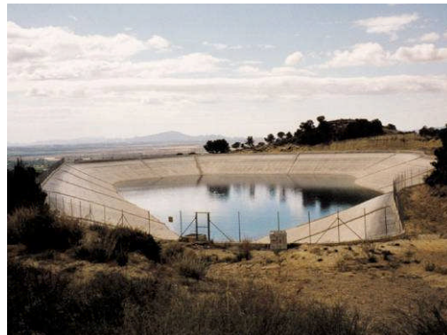
Loma Ancha, Espagne