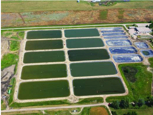
Blue Dog State Fishery, USA