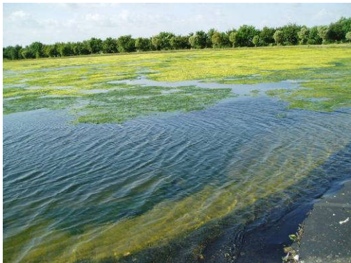
Verrines, France, 9.300 m 2 , 1992