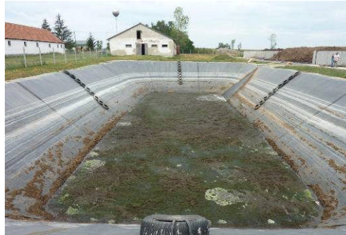
Hernadnemeti 2, Hongrie, 1.304 m 2 , 2009