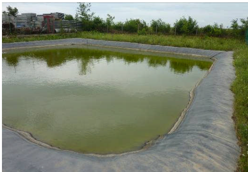
Hernadnemeti, Hongrie, 585 m 2 , 2007