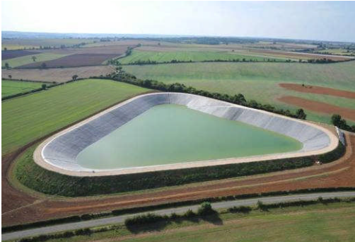
Les Groies Lorin, France, 27.000 m 2 , 2008