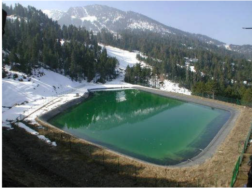
Cerdanya, Espagne, 12.000 m 2