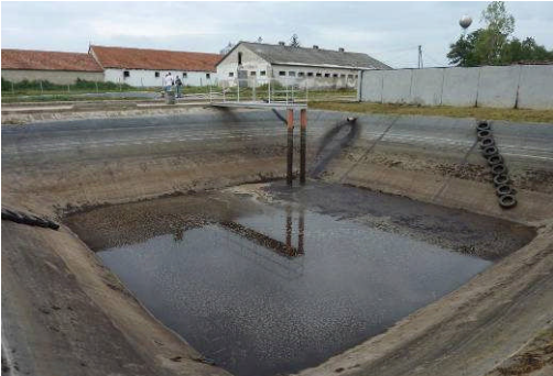
Hernadnemeti 1, Hongrie, 740 m 2 , 2008