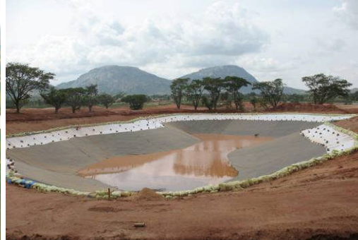
Prestige Golf & Country, Inde, 145.000 m 2