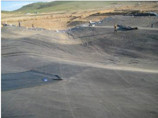
Mongolia, 55.300 m 2 , 2009