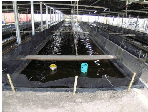
Shrimp farm raceways Texas, USA