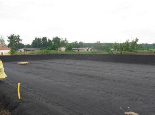
Központi - Hongrie