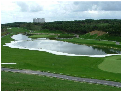
Corée du Sud