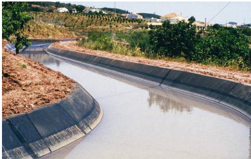
Silves, Portugal, 3km, 27.500 m 2 , 2000