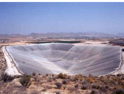
Lorca, Espagne, 41.000 m 2 , 1995