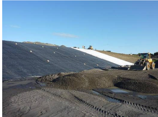
Skelleftea, Suède, 5.000 m 2 , 2009