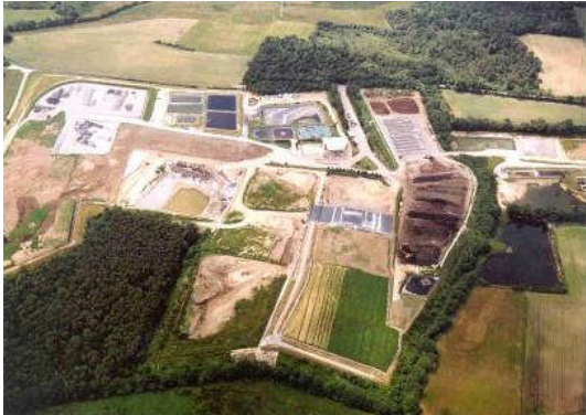
Pont-Scorff, France, 60.000 m 2 , 2000 - 2008