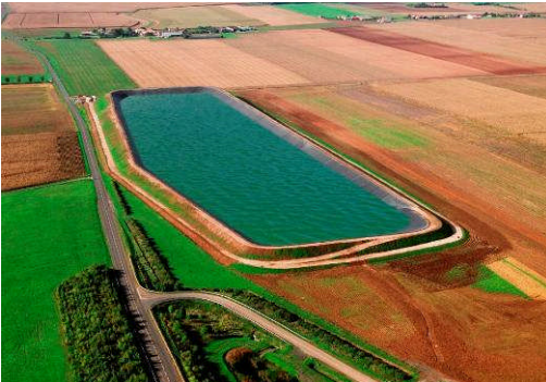
St Pierre le Vieux, France, 66.813 m 2 . 2006