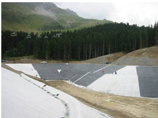
Meribel 1, France, 14.700 m 2 , 2002