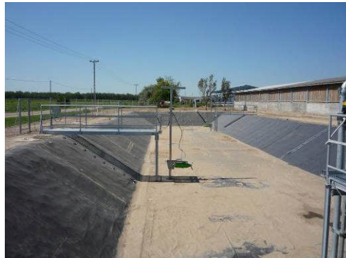
Solum - Hongrie