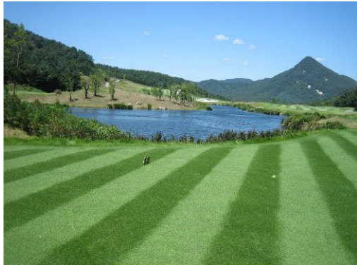
Corée du Sud