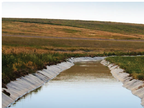
Fairfield, Montana, USA, 8,2 km