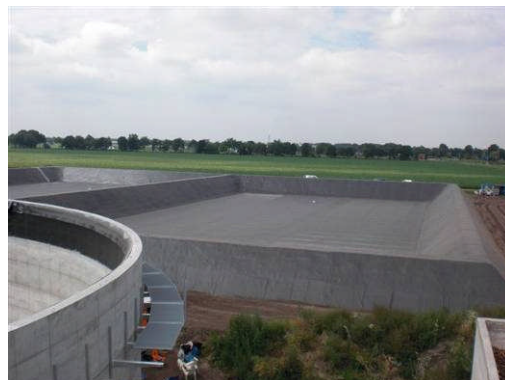
Wilbertoord, Hollande, 25.000 m 2 , 2009