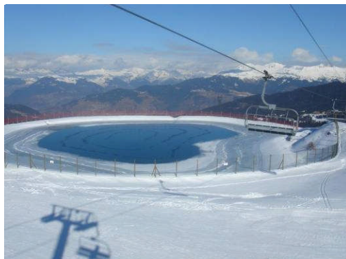
Meribel 2, France, 16.151 m 2 , 2006